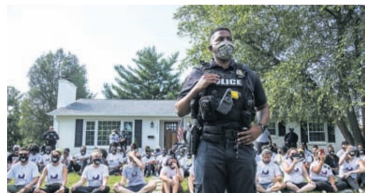
In this image from video, a Louisville Metro Police Department office stands guard outside the home of Kentucky Attorney General Daniel Cameron as protesters sit in his front yard in Louisville, Kentucky Tuesday, July 14, 2020.